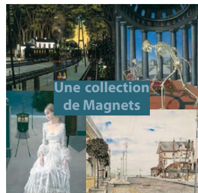
Une collection de Magnets